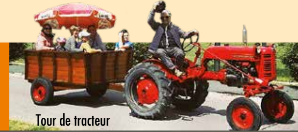
Tour de tracteur