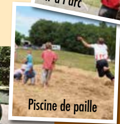
Piscine de paille