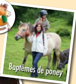
Baptêmes de poney

Centre Equestre de SIGBELL 05 63 95 25 65 St Beauzeil (82)