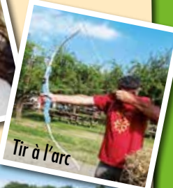
Tir à l'arc