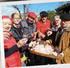
Instant de partage