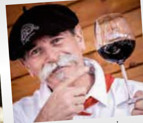
Vin et Gastronomie