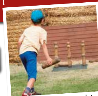
Concours de Quilles Landaises