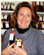
Les Vergers de Touticaut Dunes (82) 06 87 90 19 17