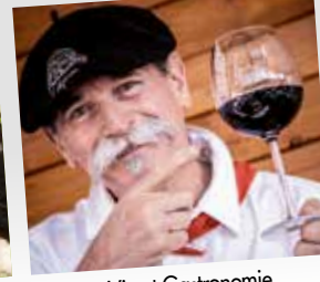
Vin et Gastronomie