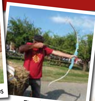
Tir à l'arc