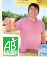
Solemiel Clairac (47) 09 53 80 70 47