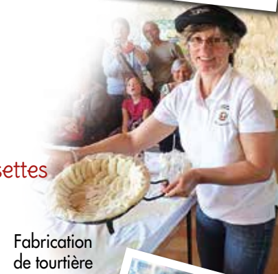
Fabrication de tourtière