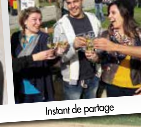
Instant de partage

L'abus d'alcool est dangereux pour la santé. À consommer avec modération.