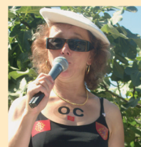
Bouquet final en chansons