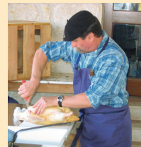
Découpe du canard et cuisson des magrets à la pierre de sel