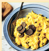
Œufs brouillés aux truffes