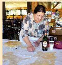
Fabrication de la tourtière