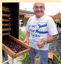
Cuisson de la prune