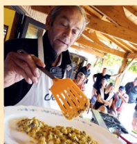
Œufs brouillés aux truffes