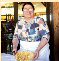
Fabrication de la tourtière