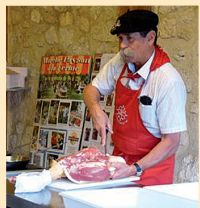
Découpe du canard et cuisson des magrets à la pierre de sel