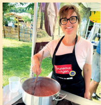
Fabrication de la confiture