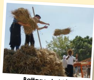
Battage du blé