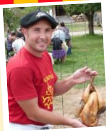
Poulet à la ficelle