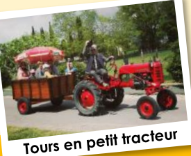
Tours en petit tracteur