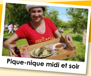
Pique-nique midi et soir