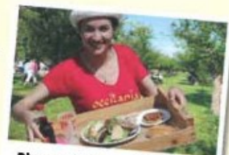
Pique-nique midi et soir