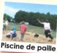
Piscine de paille