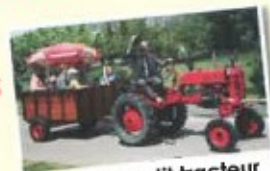
Tours en petit tracteur