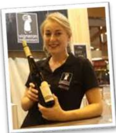
Vin d'Alsace Domaine Loberger 03.89.76.88.03