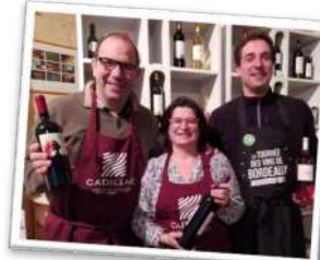
Vin de Bordeaux Château Lamothe de Haux 05.57.34.53.00