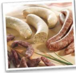
Charcuterie Maison Hardouin 02.47.40.40.40