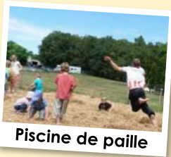
Piscine de paille