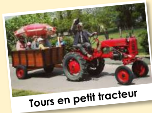
Tours en petit tracteur