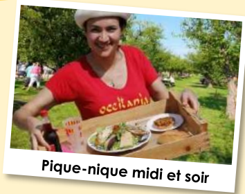
Pique-nique midi et soir